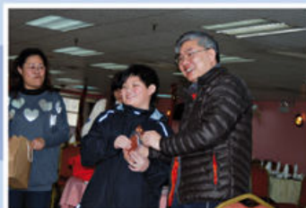
校長頒獎給遊戲勝出者