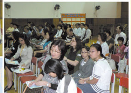
家長及老師投上他們信任的一票