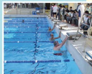
老師及家長也來一場友誼賽