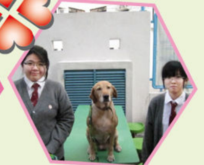
同學都喜歡與Honey一起