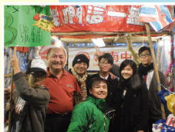
羅校監親到年宵攤位為同學打氣