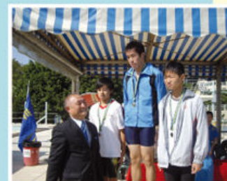
羅校監頒獎給比賽勝出學生