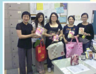
敬師日家長準備了一些小禮物答謝老師