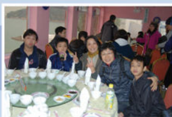
家長、老師及同學共進午餐