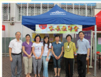
老師及家教會委員合照