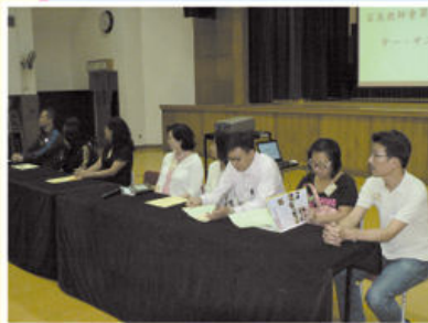
候選委員盡最後努力爭取選票