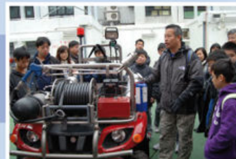
主席為同學們講解消防車的運作