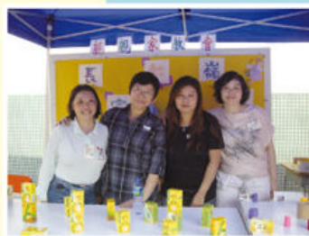
家長義工及家教會幹事