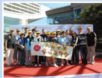
嶺南大學步行籌款