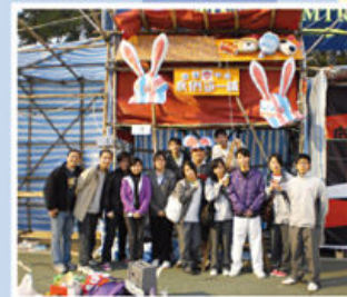
同學為年宵攤位作最後準備

家教會一直努力舉辦親子活動如親子摺紙班、親子工作坊、長洲一日遊，並熱心參與學校舉辦各項活動如嶺南同學日聚餐、東區家教會聯會晚宴、敬師日、開放日、東區聯校音樂會等等。