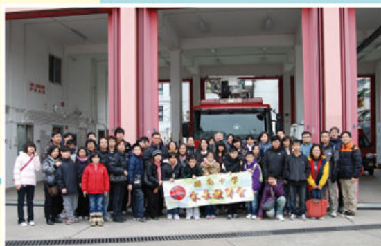
難得參觀消防局 影張大合照留念