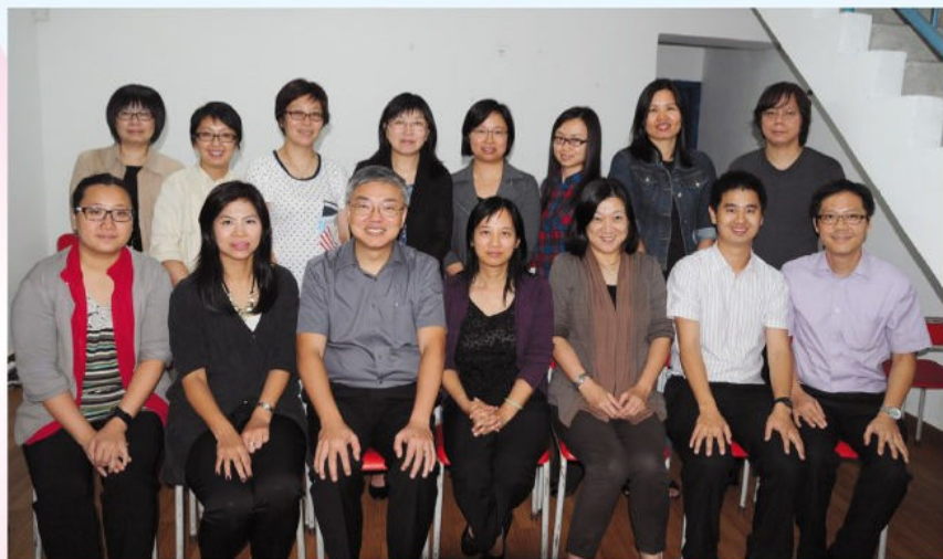
第十四屆家長教師會常務委員會合照