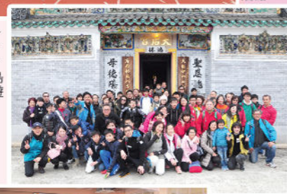
地質公園 — 東平洲、印洲塘、吉澳島親子一日遊