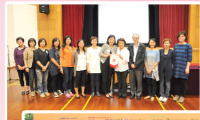
第十五屆會員大會暨常務委員會選舉