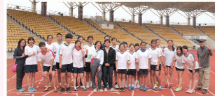
陸運會親子競技活動