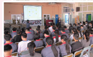
英語煮食班 Green Monday 素食推廣講座